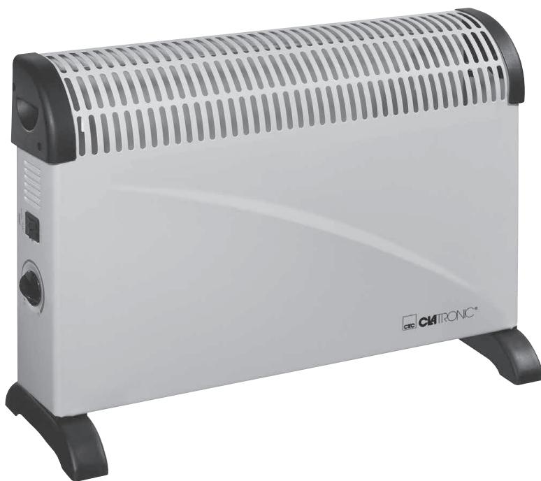
KH 3077 N